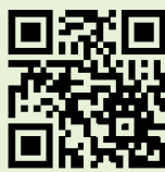
ウクライナ緊急支援募金

詳細 http://kyotoymca.or.jp/?p=7863 または、QRコードから読み取ってご覧ください。