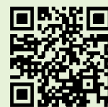
ボランティアリーダー募集