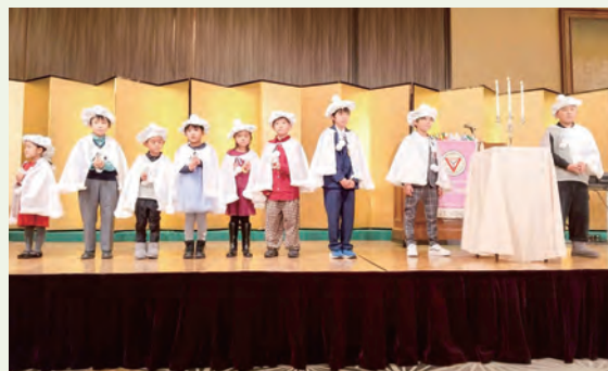
コメットの皆さん可愛いですね!