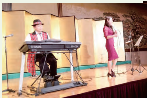
江川さん、さすがの歌唱力