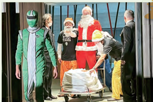
サンタが台車でやって来た