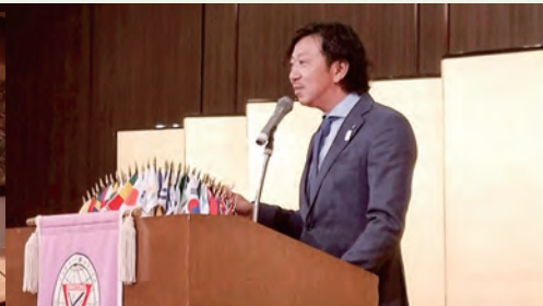
谷次期会長の乾杯でスタート!