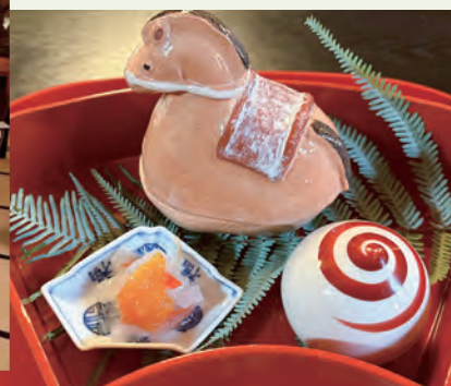
午年最初のお料理は左馬で「千客万来」