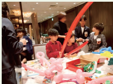
バルーンアート大人気です