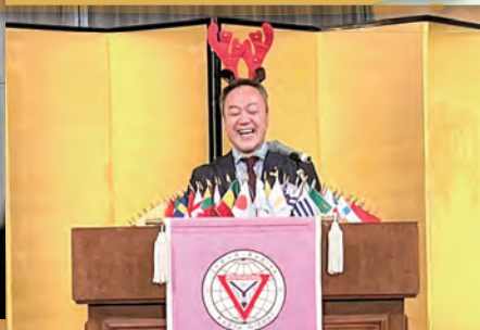
会長、サンタではなくトナカイですか