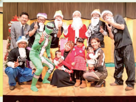
カラフルなサンタとミドリレンジャー?