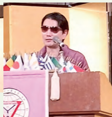
裕次郎というよりは渡哲也寄りですね