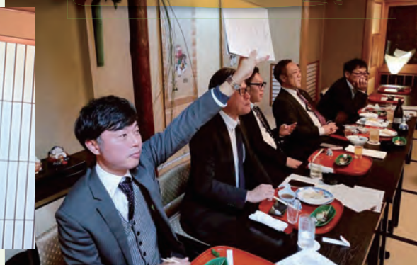
三役は全問正解しましたよね?ね?