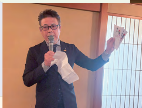
森下さん、現金がよく似合う